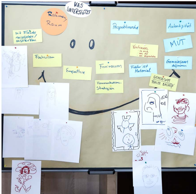
Zum Vergrößern hier klicken